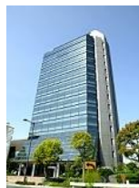
ベネッセ岡山本社ビル