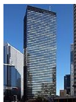
ベネッセ新宿オフィス (新宿三井ビル)