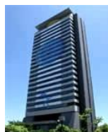
ベネッセ東京本部多摩ビル